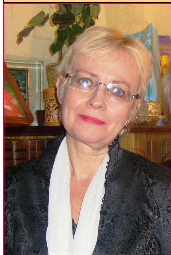
ПОЗДРАВЛЯЕМ С ЮБИЛЕЯМИ